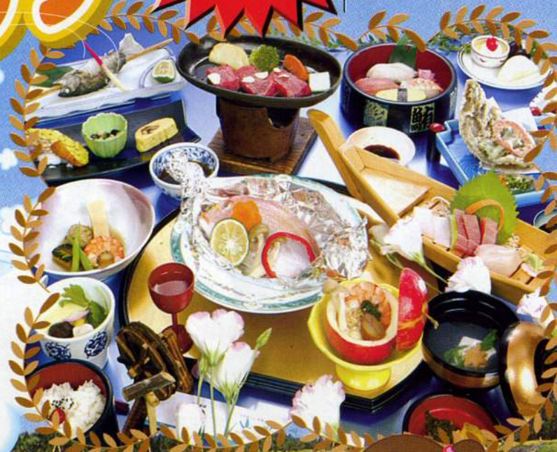
●ゴルフパック料理例